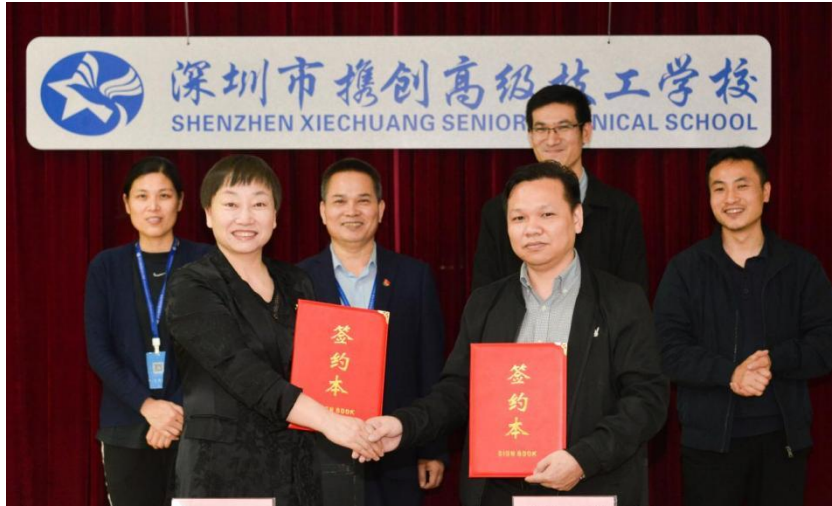
图 5：我校与深圳市美迪牙科器材有限公司签订校企合作协议书

另有 15 家相关企业共接受了 91 人进行学徒培养。2023 年 11 月，学校与美迪公司共建约 300 平方米的生产性实习实训基地，投入设备 29 种，价值约 80 多万元。