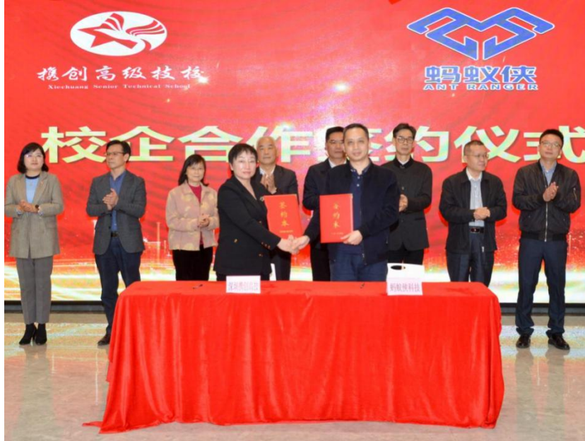
图 6：我校与蚂蚁侠（深圳）科技有限公司签约仪式现场图片