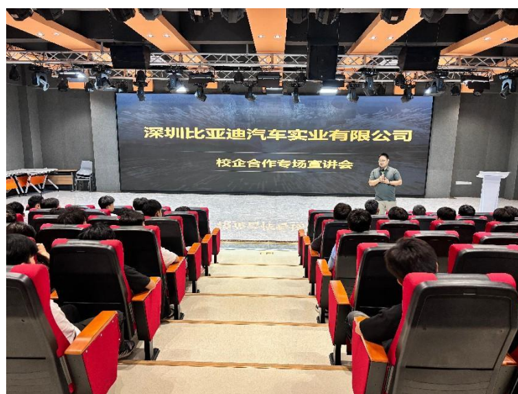
图 2：我校与比亚迪校企合作宣讲会