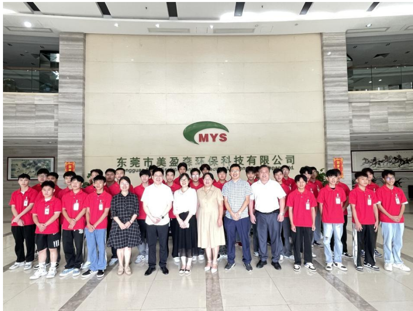
图 4：30 名学生赴美盈森集团股份有限公司实习

2023 年，我校与美盈森集团股份有限公司携手开展深度校企合作，开启了订单式人才培养计划，共培养 30 名学生。这些学生凭借扎实的专业知识和实践技能，2024 年 7 月这些学生顺利进入美盈森进行岗位实习，开启职业生涯新篇章。同年，美盈森成功入选《广东省“产教评”产业技能生态链首批链主培育单位》，为校企合作提供了更广阔的空间与机遇。