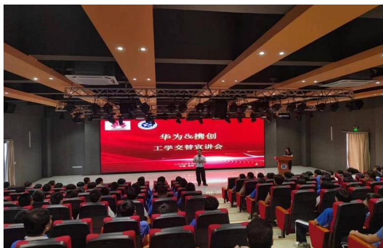
图 1：我校与华为工学交替宣讲会

深圳市携创高级技工学校智能技术学院与华为、比亚迪深度合作，旨在深化产教融合，创新人才培养模式。2023-2024 年，向华为输送 143 名学生，向比亚迪输送 372 名学生，分别进入多个岗位实习就业。校企合作培养了新能源汽车等领域的高素质复合型技术技能人才，助力广东省战略性新兴产业发展。